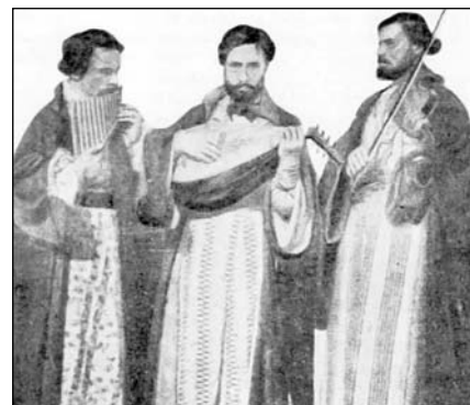
Faimos în acele vremuri a fost Barbu Lăutaru (1780-1858), starostele lăutarilor din Moldova timp de 40 de ani.

Când faci o treabă “lăutărește” înseamnă că o faci mai după ureche așa, fără să ai studii de specialitate, fără doctorat. “Lăutărește”, adică doar trecut prin școala vieții, așa cum ai prins și tu ceva din zbor, cum ai captat cu pavilionul auricular al urechilor. Pare ușor: la, la, la, hop și așa nu mă băga în dambla. Numai că până și pentru lăutarie îți trebuie talent, har, muncă, scânteie.